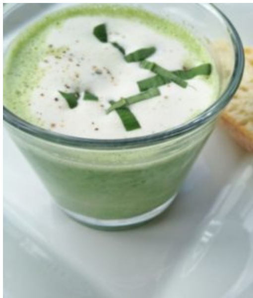
Bärlauchsüppchen – Bild 2014